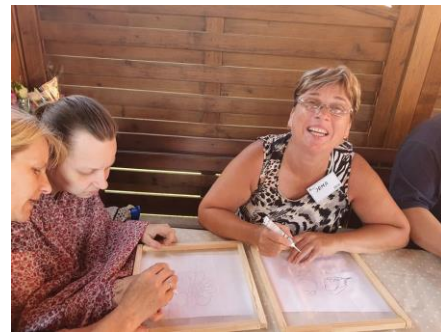
Nuotraukose: Savanorių suorganizuotos užimtumo veiklos senjoram ir neįgaliesiems