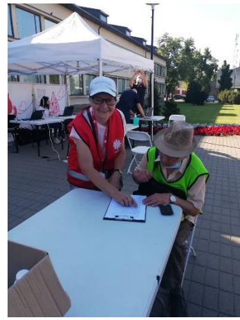
Nuotraukose: Marijampolės, Alytaus ir Prienų savanoriai vakcinacijos akcijoje