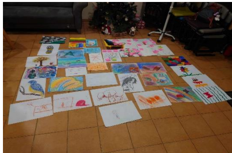
Nuotraukose veiklos „Socialinių įgūdžių ugdymo grupių vaikams ir paaugliams organizavimas ir vedimas”