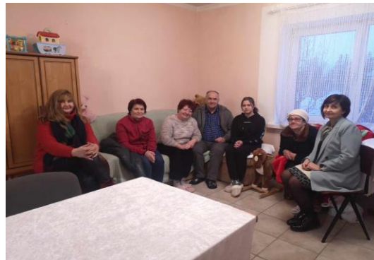
Užsiėmimai su ukrainiečiais Avikilų kaime

Veikloje „Šviečiamieji seminarai (renginiai) moterims ir mergaitėms“ nuo projekto pradžios praversti 2 mokymai, po 3 val. „Nelegalaus darbo mažinimo tema“ - 19 dalyvių. Seminarų metu buvo siekiama suteikti informaciją darbo paieškos, nelegalaus darbo, verslumo skatinimo, savarankiškumo skatinimo, moterų teisių į sveikatą, finansinę laisvę ir pan. klausimais.