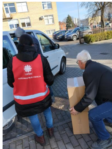
Nuotraukose Garliavos kartitiečiai