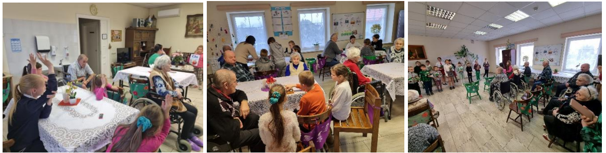
Nuotraukose: Apsilankymai Kalvarijos soc. globos namuose

higienos, laisvalaikio užimtumo ir kt. teikė 3 VDC darbuotojos (socialinė pedagogė, dvasinio ugdymo vadovė ir užimtumo specialistė). Veiklų metu buvo siekiama, kad vaikai mokytųsi pozityviai elgtis grupės aplinkoje, geranoriškai bendrautų su bendraamžiais ir suaugusiais, pasitikėtų savo jėgomis ir galimybėmis, tobulintų darbo komandoje ir kitus socialinius įgūdžius. Buvo organizuojami vaikų individualius gebėjimus ugdantys užsiėmimai (dailės, rankdarbių, futbolo, krepšinio, judrių žaidimų ir kt.), išvykos, filmų peržiūros, diskusijos, stalo žaidimai, vaikų darbinių, buities ir higienos įgūdžių ugdymas, edukacinės pamokėlės, vykdoma prevencinė veikla, kurią padėjo vykdyti Kalvarijos bendruomenės pareigūnė. Vaikai lydimi darbuotojų mokėsi atlikti įvairius kasdienės buities darbus, ugdančius jų savarankiškumą. Neužmiršome aplankyti ir savo vyresniųjų draugų iš Kalvarijos sav. globos ir užimtumo centro. Taip pat puoselėjome vaikų ir jų šeimų dvasines vertybes, vykdėme dvasinio ugdymo valandėles, dalyvavome Šv. Mišiose, atlaiduose.