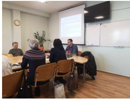
Mokymai Marijampolės užimtumo tarnyboje

Veikloje „Konsultacijos nelegalaus darbo mažinimo, prekybos žmonėmis ir priklausomybių klausimais“, nuo projekto pradžios suteikta 150 val. individualių konsultacijų, konsultacijos suteiktos 52 asmenims. Konsultacijas teikė socialinis darbuotojas. Konsultacijų tikslas - suteikti informaciją ir konsultuoti užsieniečius darbo paieškos, nelegalaus darbo, prekybos žmonėmis ir priklausomybių klausimais. Veikloje „Mokymai darbuotojams nelegalaus darbo klausimais“, nuo projekto pradžios praveisti 3 mokymai, po 3 val. - 22 dalyviai. Tikslas - suteikti žinių darbuotojams ir kitiems asmenims kaip atpažinti prekybos žmonėmis aukas, kaip atpažinti priklausomybės požymius ir padėti spręsti su tuo susijusias problemas.