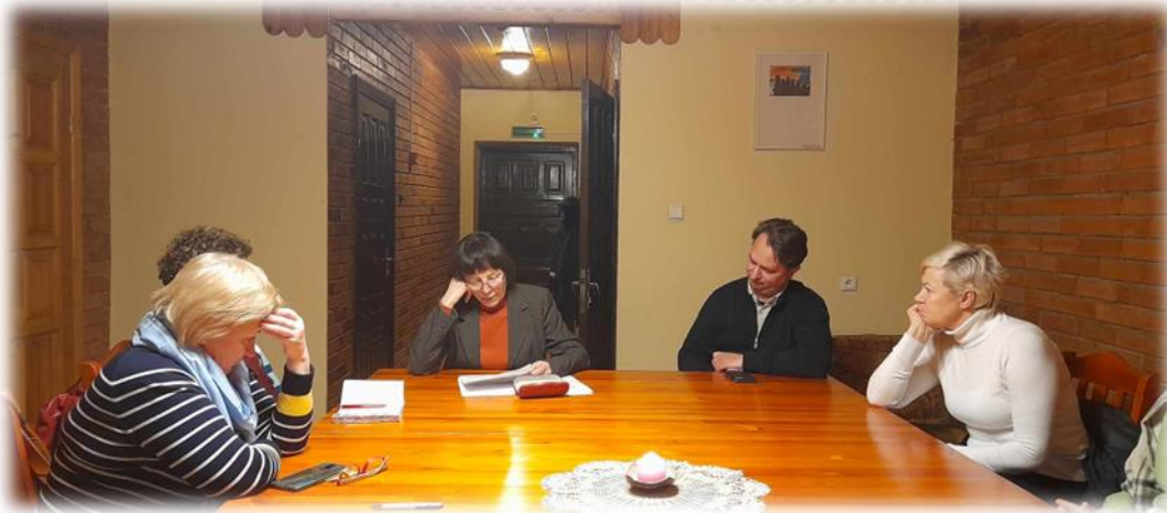
„Išklausymo tarnystės“ mokymai

Caritas savanoriai renkasi 1 kartą per mėnesį, išskyrus vasaros laikotarpį į susirinkimus aptarti su veiklomis susijusius klausimus, pasiskirsto funkcijas savanorystės darbams įgyvendinti. Kartais pasikviečia svečių (buvusių aktyvių Caritas bendruomenės narių ir kt.).